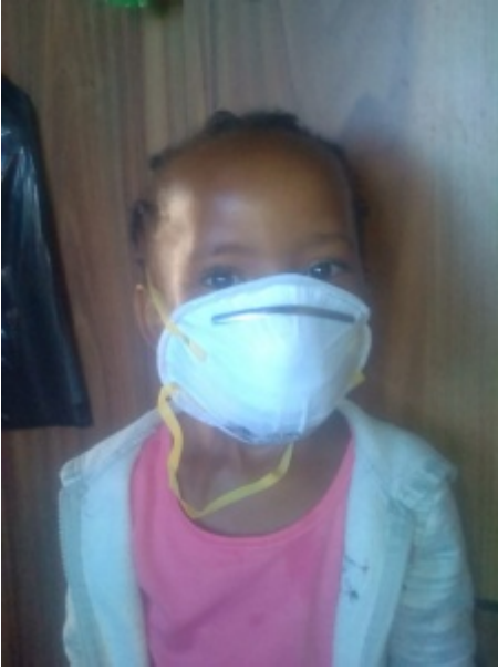
Corona-Virus in Lesotho